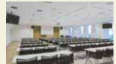
△日本青年館の研修室