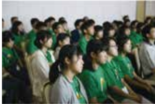
講義に集中する塾生（2017年）