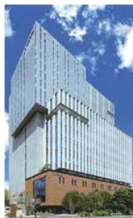
◁日本青年館の外観 (宿泊は日本青年館ホテル)

認定NPO法人 きらめき未来塾 電話 03-6454-0114 FAX 03-6454-0114