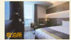
△日本青年館ホテルの客室