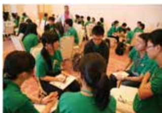
グループ別ディスカッション（2017年）