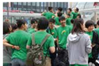
はじめまして！ 集合場所で懇談（2017年）

認定NPO法人きらめき未来塾の「夏季合宿研修」は、都道府県の教育委員会から、都道府県の高等学校にご連絡いただき、入塾される高校生の選抜は高等学校にお願いしております。ただ近年は当塾のホームページをご覧になった高校生が直接お申し込みになるケースもあり、お受けする場合があります。この案内書をご覧になり、入塾を希望される高校生は、まず別紙の申込書にご記入いただき、FAXでお送りください。その上で改めて当塾の事務局から連絡いたします。